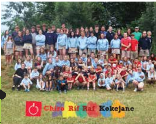
Chiro Rif Raf Kokejane