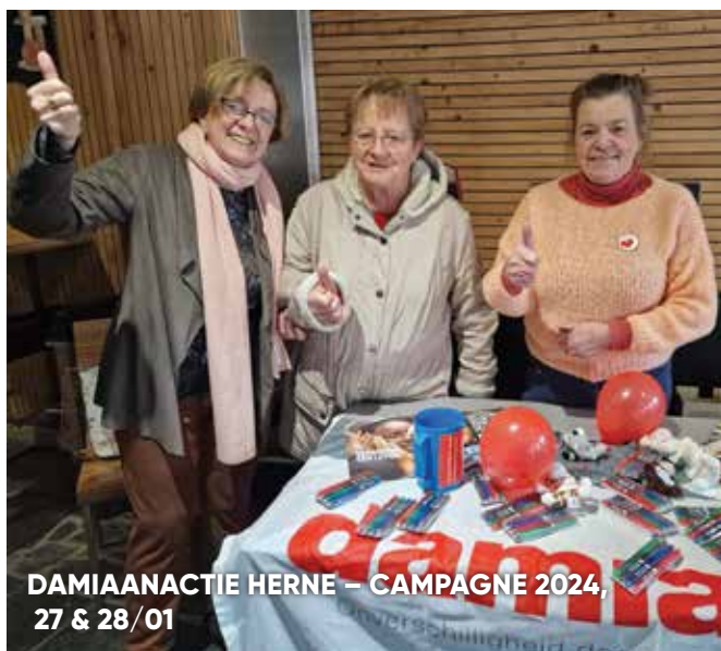
DAMIAANACTIE HERNE -- CAMPAGNE 2024, 27 & 28/01