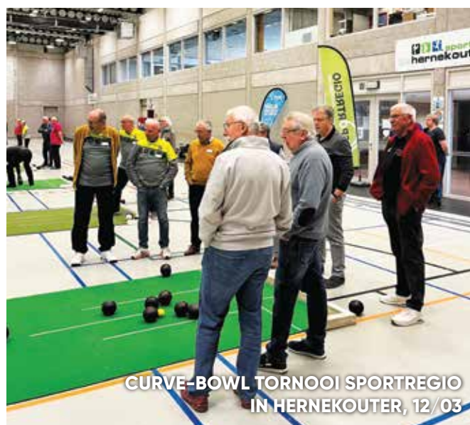
CURVE-BOWL TORNOOI SPORTREGIO IN HERNEKOUTER, 12/03