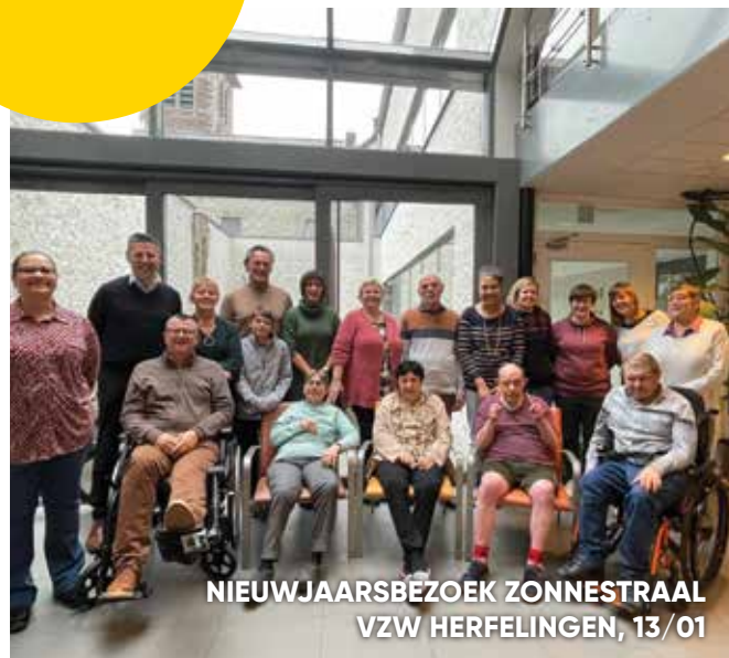
NIEUWJAARSBEZOEK ZONNESTRAAL VZW HERFELINGEN, 13/01