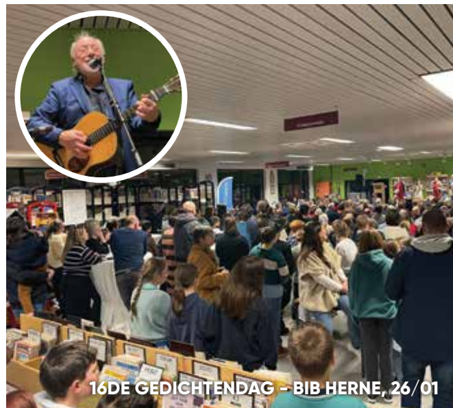
16DE GEDICHTENDAG -- BIB HERNE, 26/01