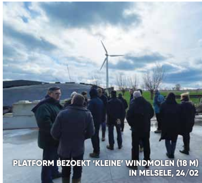
PLATFORM BEZOEKT 'KLEINE' WINDMOLEN (18 M) IN MELSELE, 24/02