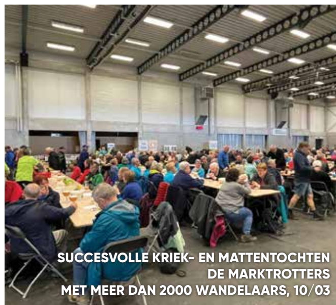
SUCCESSVOLLE KRIEK- EN MATTENTOCHTEN DE MARKTROTTERS MET MEER DAN 2000 WANDELAARS, 10/03