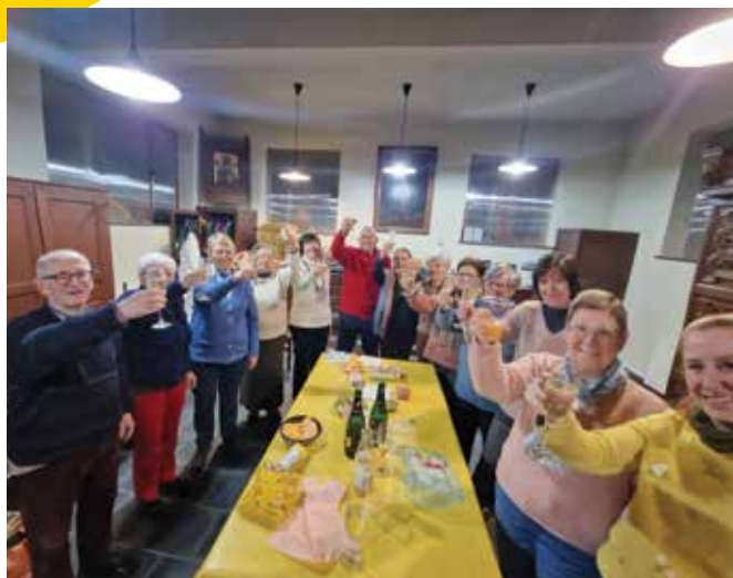
NIEUWJAARSRECEPTIE LEGATO, 10/01