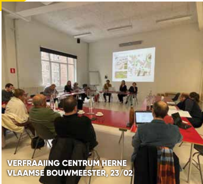
VERFRAAIING CENTRUM HERNE VLAAMSE BOUWMEESTER, 23/02