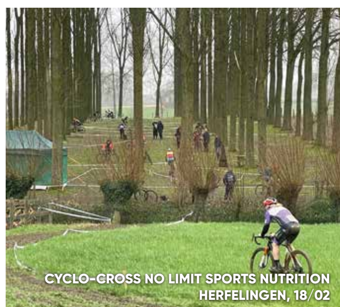
CYCLO-CROSS NO LIMIT SPORTS NUTRITION HERFELINGEN, 18/02