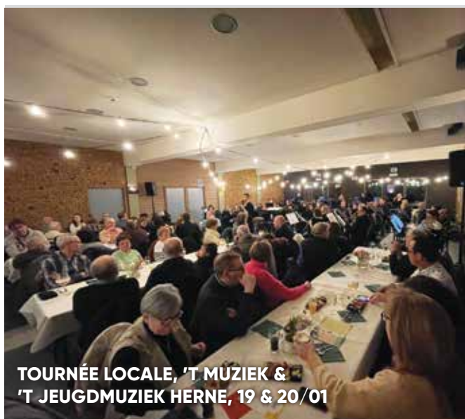
TOURNÉE LOCALE, 'T MÚZIEK & 'T JEUGDMÚZIEK HERNE, 19 & 20/01