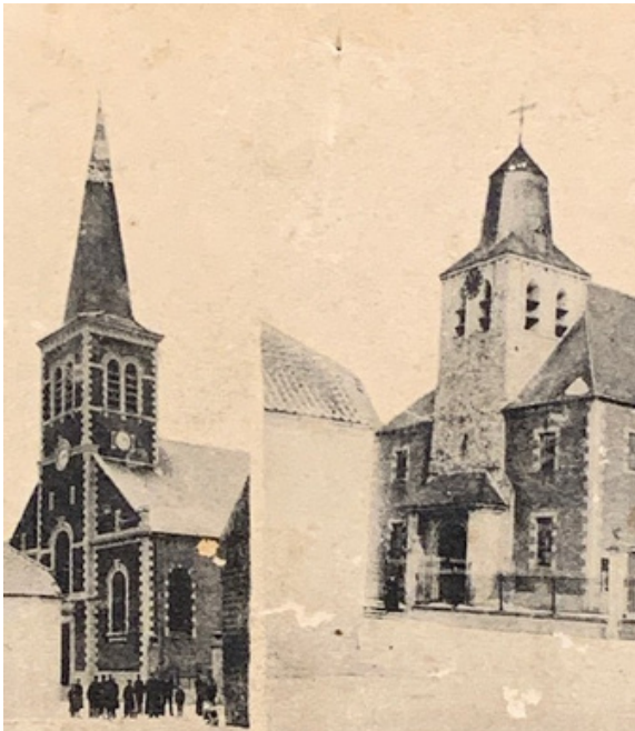
links: de kerk voor 1970 rechts: de kerk voor 1871

Wanneer we voor de zaal staan, nemen we het kleine baantje naar links. Op het einde gaan we terug naar links, we steken het kerkplein over en lopen door naar het portaal van de kerk.