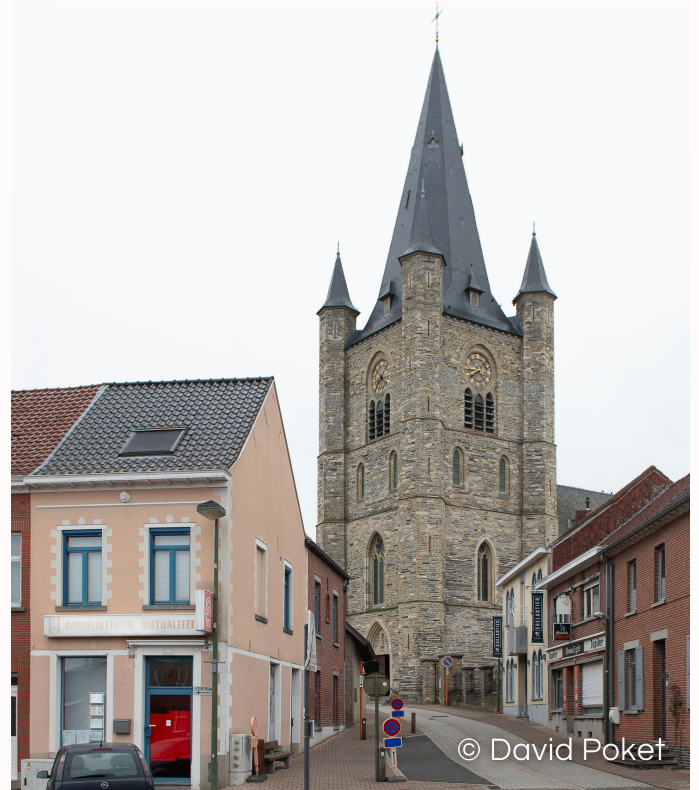
de kerk anno 2021