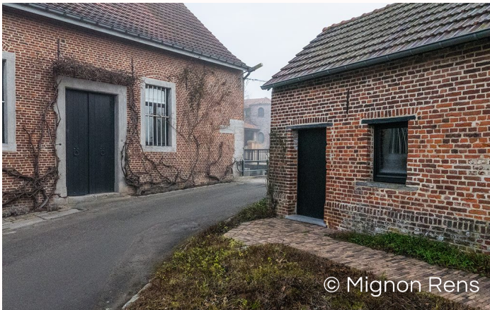
De boesmolen en zijn bijgebouw.

De straat is genoemd naar de molen aldaar, één van de drie watermolens op het Groot-Hernes grondgebied. De naam zou afgeleid zijn van Bossemel (mel voor molen, bosse voor bos). Ook hier is het rad nog te zien, maar het draaien stopte in 1963. Daarna werd het molengebouw nog even uitgebaat als dancing en stoeterij. Nu is het ingericht als private woning. Het bankje naast de molen nodigt menig wandelaar uit tot verpozen en de omgeving is tevens een geliefd plaatsje voor fotografen.