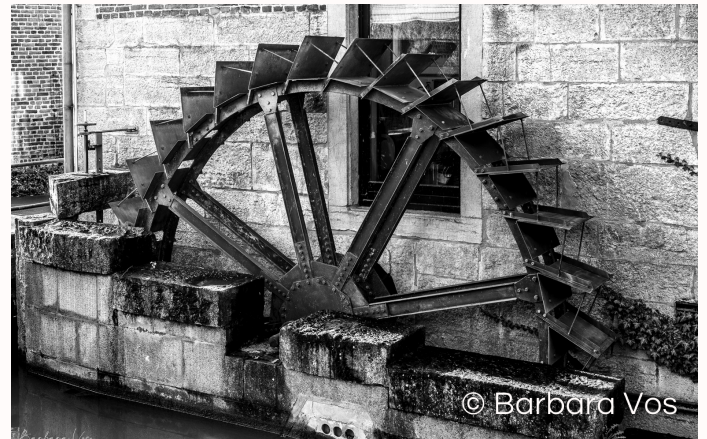
Het rad stopte met draaien in 1963.

Keer een 150-tal meter op je stappen terug wanneer je genoeg bent uitgerust. Sla aan knooppunt 403 links het wandelpad in, door de weide, richting wandelknooppunt 4.