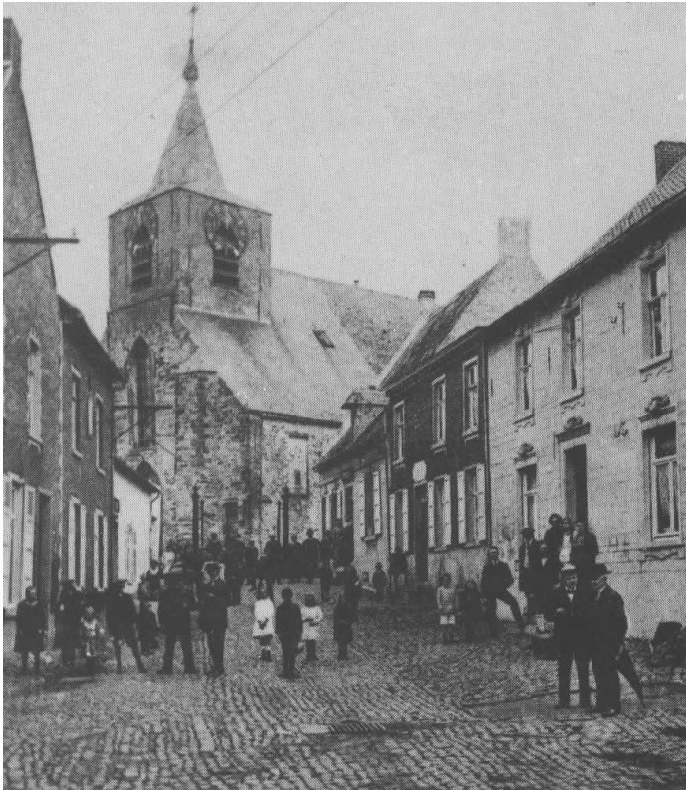
de kerk voor 1923